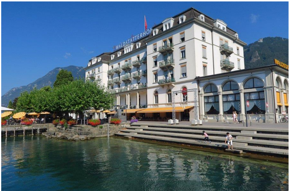
Seehotel Waldstätterhof in Brunnen

Bitte Zimmerbuchung direkt bei Brigitte Lüthy bis spätestens am 27. Juli 2022. Nach diesem Datum werden die von uns reservierten Zimmer wieder freigegeben. Kosten der Übernachtung bitte direkt im Hotel begleichen.